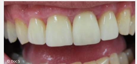
Veneers der oberen vier Schneidezähne 12 Jahre (!) nach dem Einsetzen

Ein weiterer großer Vorteil ist die Farbbeständigkeit von Veneers: Sie verfärben sich auch nach vielen Jahren nicht, sondern behalten ihre ursprüngliche Helligkeit - selbst bei Rauchen.