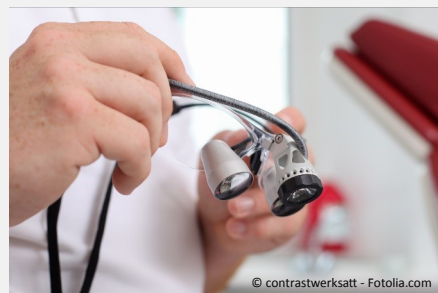
Wurzelbehandlung mit Hilfe der Lupenbrille: Bis zu fünffache Vergrößerung ermöglicht exakteres Arbeiten und bessere Ergebnisse.

Wurzelkanäle sind nur wenige Zehntelmillimeter dünn. Sie können Verästelungen, Krümmungen oder Stufen haben. Mit bloßem Auge sind solche Feinheiten nicht erkennbar. Deshalb werden sie leider oft übersehen.