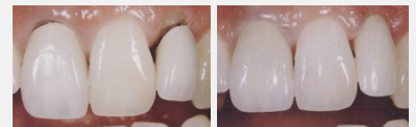
Metallkeramik-Kronen mit dunklen Rändern (links) und ästhetische Kronen aus reiner Keramik (rechts).

Wenn Sie wirklich schöne Zähne wollen, sollten Sie sich für Kronen und Brücken aus reiner Keramik entscheiden.