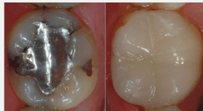
Bedenkliches Amalgam (links) oder verträgliche und ästhetische Füllungen aus Komposit oder Keramik (rechts)?

Als Kassenpatient haben Sie die Wahl zwischen Amalgam und kurzlebigen Kunststoff-Füllungen. Wenn Sie eine dauerhaftere und schönere Lösung wollen, sollten Sie sich für Kompositfüllungen oder für Keramikinlays entscheiden.