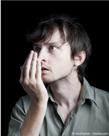
Mundgeruch kann unsicher, gehemmt und einsam machen ...

Fühlen Sie sich manchmal anderen gegenüber gehemmt?